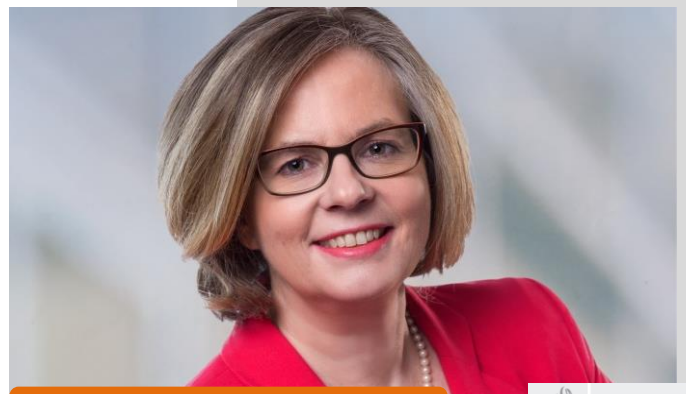
Ursula Groden-Kranich MdB